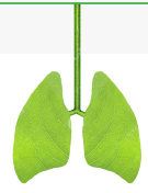
Planten in de kas zijn de groene longen van het gebouw